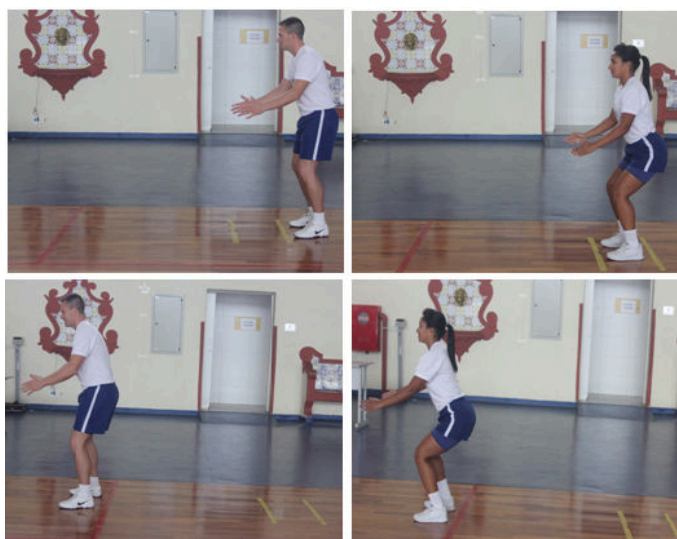
Figura 3 - Teste de salto horizontal.

Obs.: Neste teste, serão exigidos os mesmos padrões de execução para ambos os sexos.